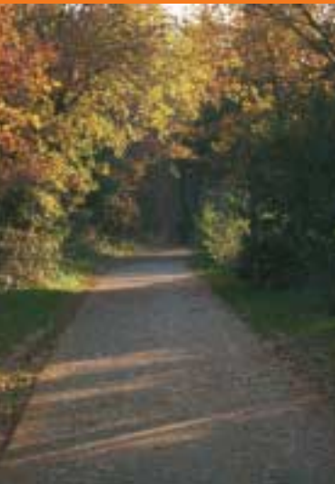
Romeinse weg Malden

Middenin het Heumensoord, precies halverwege Nijmegen en Cuijk, zijn de resten van drie achtereenvolgende gebouwen gevonden. In de tweede eeuw stond hier mogelijk een mansio of statio , een soort wegrestaurant waar ruiters van de keizerlijke koeriersdienst van paard konden wisselen. In de derde eeuw bouwden de Romeinen er een wachtpost, die ze herbouwden in de vierde eeuw. Zijn voornaamste functie was het bewaken van de weg en het doorgeven van boodschappen door middel van