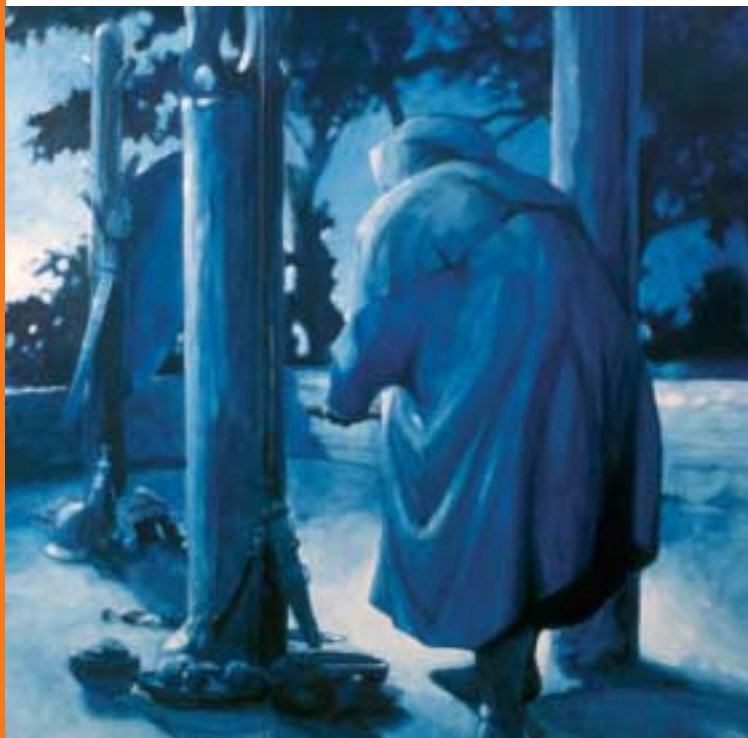
Impressie van een inheems heiligdom in de openlucht

U bevindt zich hier in het Bekken van Groesbeek. Het land is uiterst vruchtbaar door de lössgrond, fijn zand dat letterlijk is komen aanwaaien. Buiten Limburg is het de enige plek in Nederland waar deze grondsoort op grote schaal voorkomt. Vanwege de vruchtbaarheid is deze plek al vanaf de IJzertijd bewoond. In de eerste eeuw hadden de bewoners nauwe banden met het Romeinse leger, getuige de vele vondsten van Romeins aardewerk, paardentuig en duur mozaïekglas. Zouden dat Bataven kunnen zijn, die na 25 jaar diensttijd terugkeerden naar hun geboortegrond? De vondsten van vooral kledingspelden en munten doen vermoeden dat hier vlak in de buurt ook een inheems (Bataafs?) openluchtheiligdom heeft gestaan.