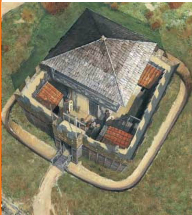
Wachtpost Heumensoord

vlaggen en lichtsignalen. Zo konden de soldaten in Nijmegen snel worden gewaarschuwd, bijvoorbeeld bij een inval van de Franken. De contouren en grachten van de wachtpost zijn nog altijd te zien. Stelt u zich voor dat u op de acht meter hoge toren zou klimmen en denk daarbij voor het gemak even het bos weg: in dat geval zou u zowel Nijmegen als Cuijk kunnen zien liggen. Aan de voet van de wachtpost is de Romeinse weg teruggevonden: zes meter breed, zoals ook het tracé in Brabant, maar zonder verharding van grind. Doordat de zandige bodem hier van nature grind bevat, zal een extra verharding niet nodig zijn geweest. De loop van de Romeinse weg kunt u herkennen aan de enigszins afwijkende richting van het pad. Met enige moeite is de weg in het bos nog enkele honderden meters te volgen. Op sommige gedeelten is parallel aan deze weg nog een tweede weg ontdekt. Kennelijk hebben de Romeinse wegenbouwers in de loop van de tijd de oorspronkelijke weg een stukje moeten verleggen.