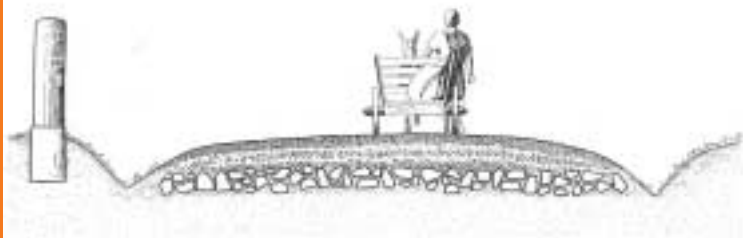
Doorsnee Romeinse weg

Ook de Hertogstraat is onderdeel van de Romeinse snelweg. In de Middeleeuwen heette de Hertogstraat nog 'Hertsteeg'. De naam heeft niets te maken met hertogen, maar met 'heer' - het oude woord voor 'leger'. En zo'n heerstraat verwijst weer onverbidlijk naar een Romeinse oorsprong. Soms ligt het verleden voor het oprapen. Als je er maar oog voor hebt.