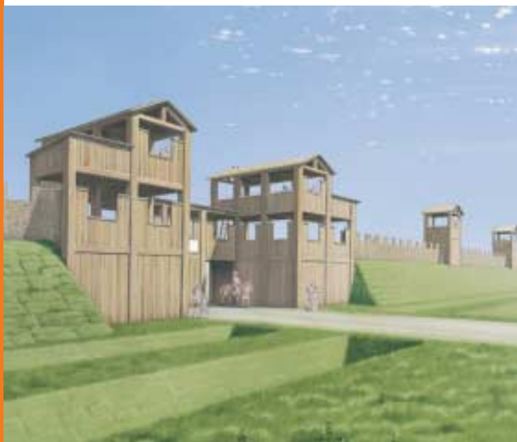
Houten poort van het legerkamp uit de tijd van Augustus

Precies op het einde van de Ubbergseveldweg stond de poort van het houten legerkamp van Augustus (uit 18 v.Chr.) en de stenen legioensplaats van het Tiende Legioen (70-105). U fietst beide kampen nu dus uit. De Beekmansdalseweg aan uw linkerhand is een natuurlijk dal dat de Romeinen gebruikten als weg. Links boven de Beekmansdalseweg kunt u zien hoe het terrein van de legerplaats zich verder uitstrekt tot aan de rand van de heuvel. Vanwege het hoogteverschil is dit terrein de meest strategische locatie in de wijde omgeving.