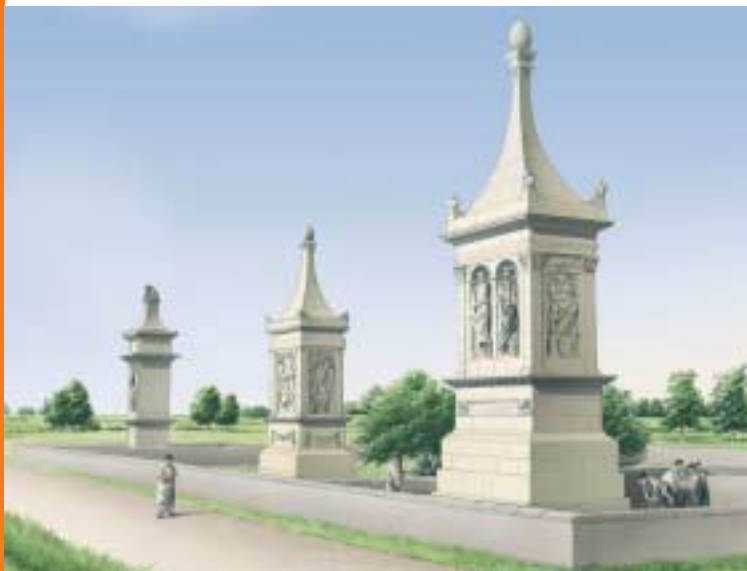
Grafmonumenten langs een weg

Bij de bouw van de spoorbrug, aan het eind van de 19 e eeuw, vond men hier een Romeins grafveld. Niet vreemd, want Romeinen lieten zich graag begraven langs grote wegen. De Rijksweg volgt een stukje van die Romeinse weg.