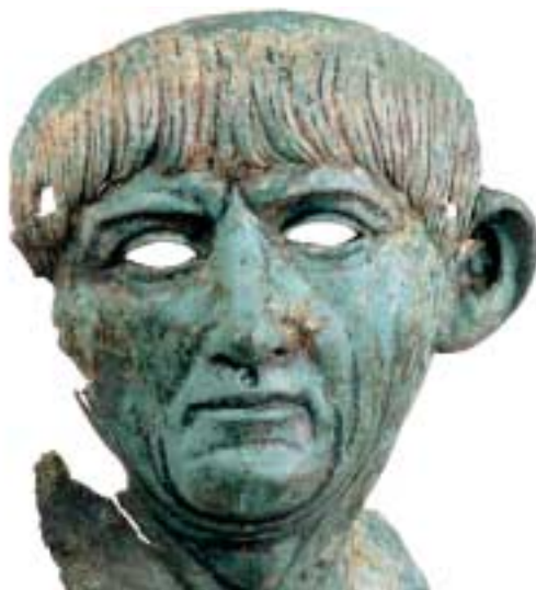
Bronzen portret van Traianus, Museum Het Valkhof

Midden op het naar hem genoemde plein staat een standbeeld van keizer Traianus. Hij staat eigenlijk aan de verkeerde kant van de stad: de nederzetting die van hem rond het jaar 100 stadsrechten kreeg, ligt in het huidige Waterkwartier in Nijmegen-West. Traianus gaf de stad ook nog het recht om zijn familienaam Ulpus te gebruiken, zodat de stad voluit Ulpia Noviomagus ging heten.