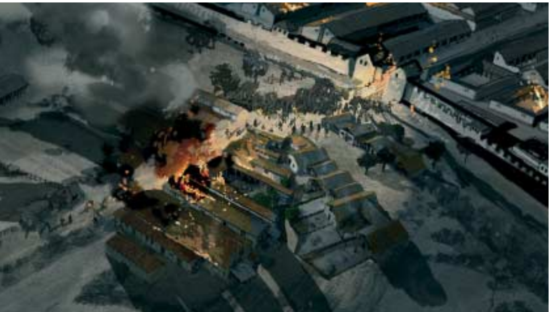
Bataafse opstand (bron: Kelvin Wilson)

Rond 18 voor Christus kwamen de Romeinen voor het eerst in ons land. In Nijmegen-Oost legden ze een groot legerkamp aan op de Hunerberg. Even daarna bouwden ze op en rond het Valkhof een hoofdstad voor de Bataven, Oppidum Batavorum . Na de Bataafse Opstand in 69-70 herbouwden de Romeinen het legerkamp op de Hunerberg in steen. Tegelijk verrees in Nijmegen-West een compleet nieuwe stad, Ulpia Noviomagus . Deze stad kreeg rond het jaar 100 officiële stadsrechten van keizer Traianus en is daarmee met afstand de eerste en oudste stad van Nederland. Ruim 150 jaar later werd Noviomagus verlaten. De overgebleven bevolking trok zich terug rond het Valkhof, waar een indrukwekkend fort hen beschermde. Vlak na het jaar 400 namen de Franken de macht over en verdwenen de Romeinen geruisloos van het toneel.