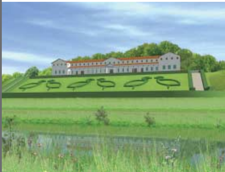
De Romeinse villa met monumentale tuinaanleg

De heuvelrand is een overblijfsel uit de IJstijd. Meer dan honderd meter dikke gletsjers schoven vanuit Scandinavië een enorme berg van zand, leem en grind voor zich uit. Ongeveer op de lijn Nijmegen-Xanten trok het ijs zich terug en liet een heuvelrand achter in de vorm van een stuwwal. Door regenwater sleep de steile heuvelrand af tot een gelijkmatig aflopende helling, een spoelzandvlakte. De legionairs van keizer Augustus hadden ogenblikkelijk in de gaten dat dit een ideale plek was om hun legerkamp op te slaan: hoog, vlak, en dichtbij de Waal. Ook Oppidum Batavorum en Ulpia Noviomagus lagen op de rand van deze spoelzandvlakte.