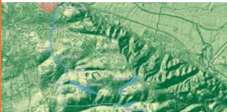
Vermoedelijke tracé van het aquaduct

We staan hier aan het begin van de waterleiding ( aqueduct ) van de Nijmeegse legioensplaats. De Romeinen groeven op deze plek een diepe geul om bronnen ( sprengen ) aan te boren, én om op de juiste hoogte te komen voor een gelijkmatig verval van de waterleiding. Op de randen liggen nog steeds grote bergen aarde, destijds met de hand uitgegraven. Het aquaduct is circa 5 km lang.