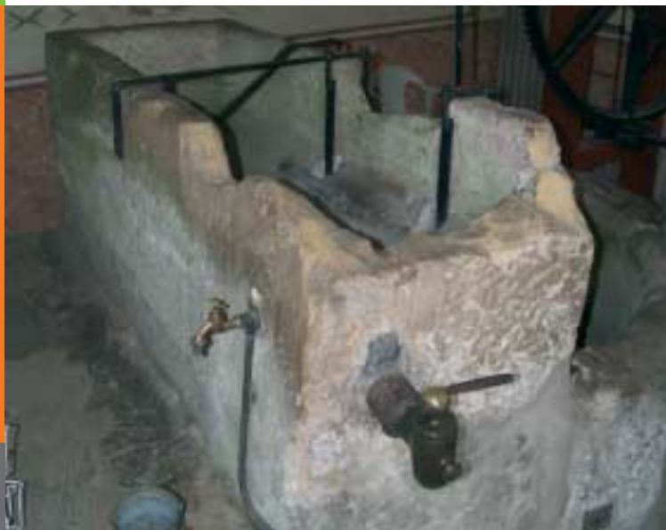
Romeinse sarcofaag op de niet-Romeinse Drususput