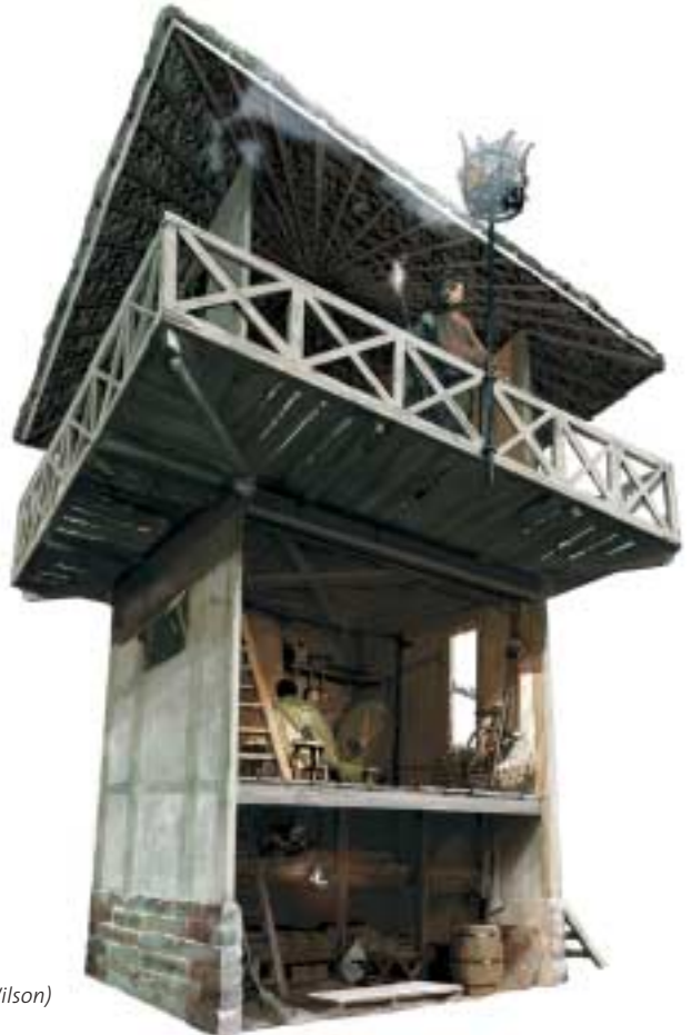
Romeinse wachttore

De route is ook in hedendaagse zin grensoverschrijdend: we rijden een heel stuk door Duitsland. Misschien ten overvloede: in Duitsland geldt net als in Nederland een identificatieplicht. Daarnaast is het vanwege de klim op de Elterberg verstandig om een fiets met versnellingen mee te nemen. We geven overigens ook een alternatieve route om de klim te vermijden. Tot slot: houdt u er rekening mee dat het fietspontje Millingen-Rijnwaarden maar eens per uur vaart. Van oktober tot en met maart elk twee uur (zie tijden op pagina 2). Geen nood, hier ligt ook een ideale pauzeplek.