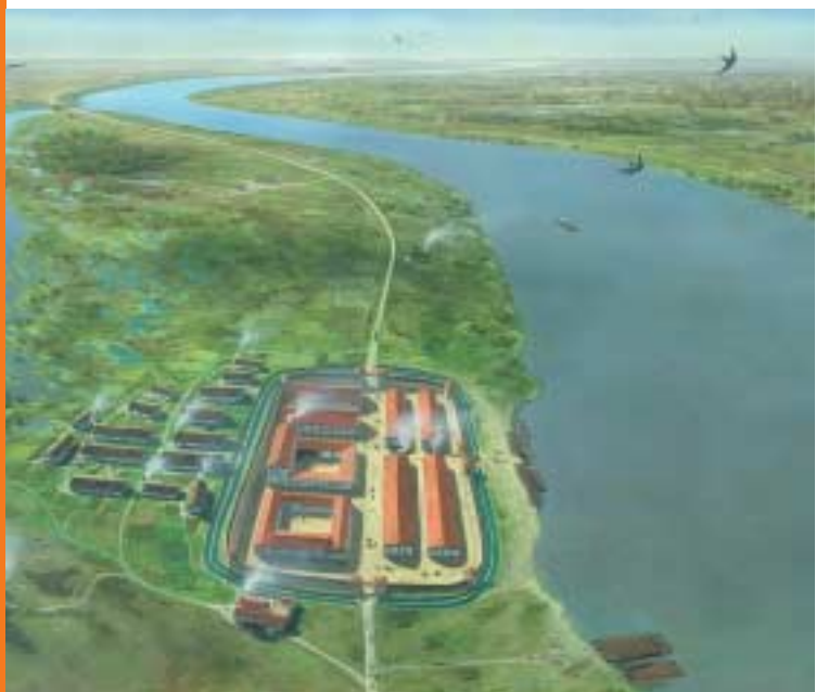
Reconstructie van een castellum aan de Rijn (bron: Ulco Glimmerveen)

In de jaren dertig is de grond tussen de Oude Waal en het Bijlandsch Kanaal afgegraven voor zandwinning. Er kwamen zoveel Romeinse vondsten boven water dat hier met zekerheid een Romeins fort of castellum moet hebben gelegen. Volgens de verhalen lag een strook van 200 bij 70 meter bezaaid met bouwpuin. Hoewel het fort niet bekend is uit antieke bronnen, weten we wel de naam van het fort. Dat komt door de vondst van een altaarsteen voor Marcus Mallius, opgebaggerd in 1938. Daarop