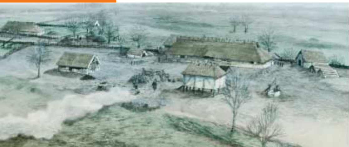
Impressie van een inheemse nederzetting