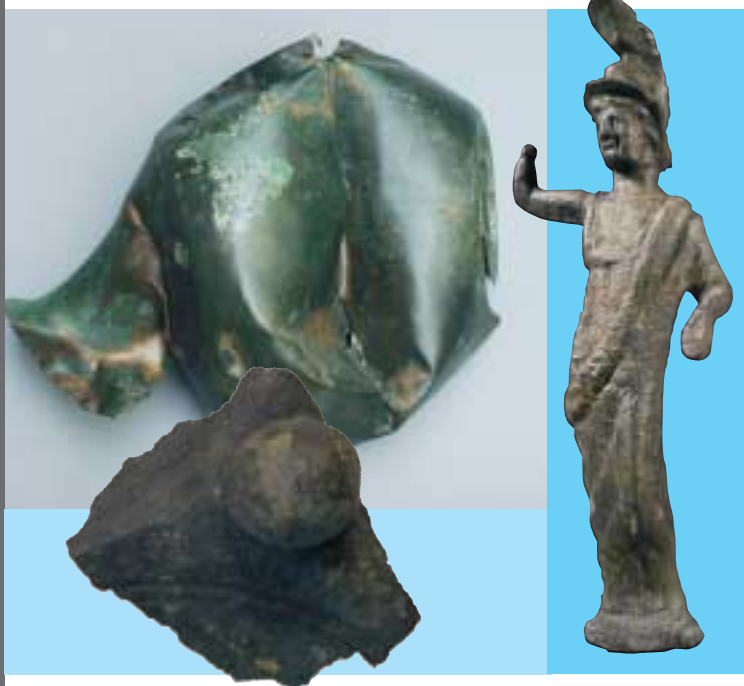
Bronzen kan (MHV), Minerva (collectie H.A.S) en fragment Dodecaëder (collectie H.A.S)

In Didam is een hoekje van een dodecaëder gevonden. Dodecaëders zijn metalen voorwerpen, bestaande uit twaalf vijfhoeken met grote ronde gaten. Op de hoekpunten zijn bolletjes bevestigd. Ze komen alleen voor in de Romeinse tijd in Noord-west Europa en hun functie is nog altijd niet zeker. Sommigen vermoeden dat ze dienden om de ideale zaaitijd van gewassen te bepalen. Je kon er waarschijnlijk de hoek van het zonlicht mee meten. Opmerkelijk is dat de Didamse dodecaëder is gevonden buiten het voormalige Romeinse rijk.