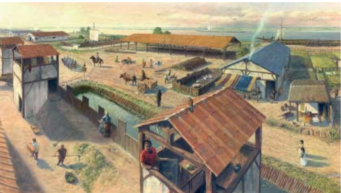
Castellum te Woerden

In Romeinse ogen was de Rijn misschien wel de belangrijkste rivier van Europa. Julius Caesar beweerde in zijn verslag van de Gallische Oorlogen (rond 55 v.Chr.) dat hij alle volkeren tot aan de Rijn had onderworpen. Wetenschappers twijfelen echter of hij wel op Nederlands grondgebied is geweest. Dat was Drusus zeker wel. Deze zoon van keizer Augustus leidde vlak voor het begin van de jaartelling vanuit Nijmegen enkele veldtochten naar Germanië. Ook liet hij waterstaatkundige werken uitvoeren om ons drassige landje wat beter begaanbaar te maken: zo bouwde hij een dam in de Rijn om het water tussen Rijn en Waal te reguleren en liet een kanaal graven tussen Rijn en Oude IJssel.